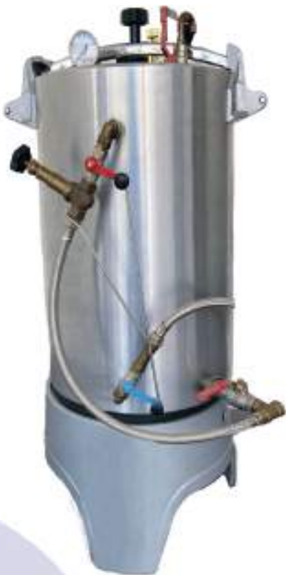
Semi automatique électrique